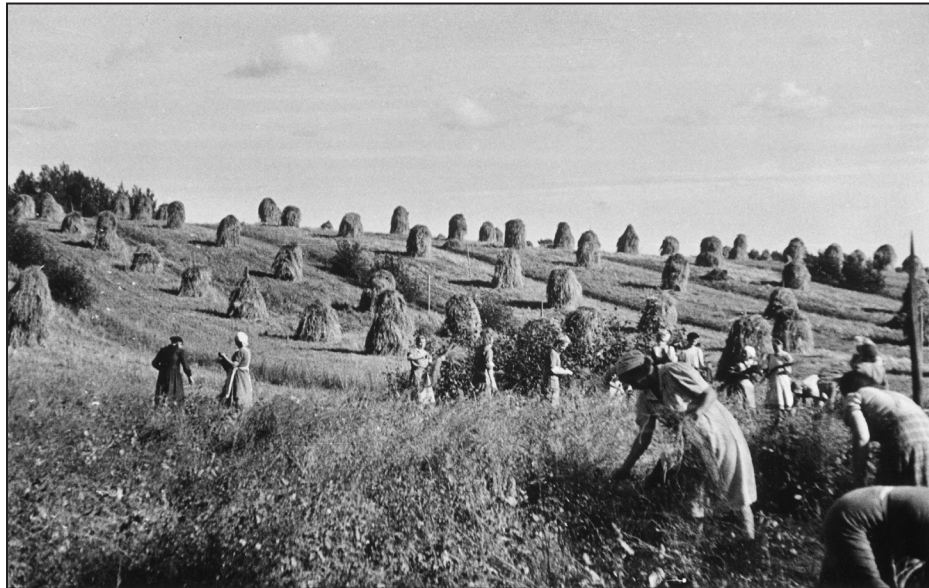
Karjatalouden kasvu edellytti heinäviljelyn lisäämistä. Heinäseipäät olivat olennainen osa suomalaista maisemaa noin sadan vuoden ajan. Etualalla kerätään pellavaa. Suomen maatalouden historian 2. osan kuvitusta.

Suomen maataloushistorian toisen osan kuvitus on monipuolinen. Teos sisältää runsaasti valokuvia eri puolelta Suomea yhteensä 24 kuva-arkiston kokoelmista. Tietävästi ensimmäistä kertaa näin kattavasti on käytössä I. K. Inhan Pariisin maailmannäyttelyn Suomen osastoa varten ottamia kuvia. Muita valokuvaajia ovat esimerkiksi Signe Brander, Ivar Ekström ja Samuli Paulaharju.